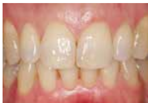
Zdrave roza dlesni

Zdrave dlesni so blede, rožnate in čvrste. Ne krvavitvijo pri umivanju in čiščenju med zobmi.